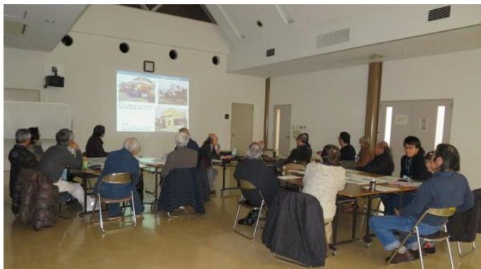
第2回ワークショップの結果の報告 すてきな外構選びの結果の確認