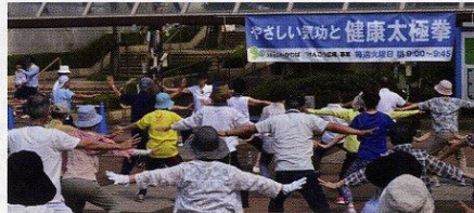
< 5回目(7月5日)「形」ができて来ました >

6月7日から始まった「けんこう広場(健康太極拳)」も3か月たちました。「けんこう広場」の目的は、①健康寿命の維持、②地域のコミュニケーションの場づくり、③かりばプラザの活性化、などに役立つことです。住み慣れた街で、仲の良いお友達がいいて、いつまでも健康で、安心して住み続けられる「理想のすみか」づくりに役立つことができればとの思いです。